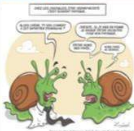
Illustration : Sébastien Bacco «Lambada» Texte : Christian Durand

habitants) et un atelier bandes dessinées à la résidence Horizon Habitat Jeunes le jeudi 15 février à 19h (entrecoupé de saynètes* jouées par des comédiens professionnels).