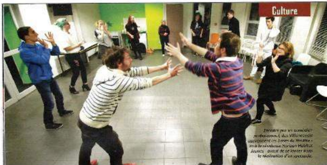
Premier pas vers comédien professionnels. Les Villeneuvois découvrent les bases du théâtre - en à la résidence Horizon Habitat Jeunes - avant de se lancer dans la réalisation d'un spectacle.