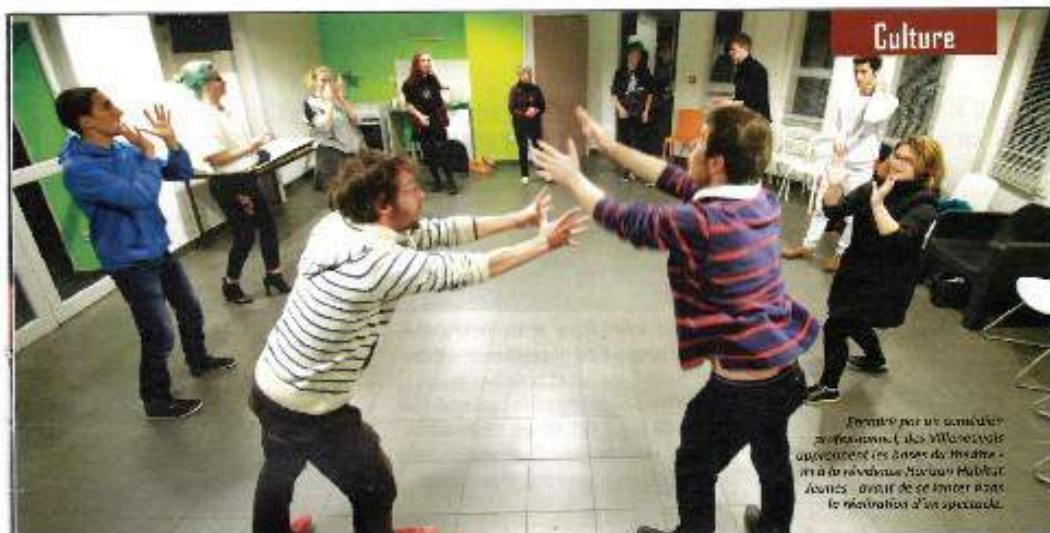
Premier pas vers un comédien professionnel. C'est Villeneuve qui accueillera les ateliers de théâtre - en à la résidence Horizon Habitat Jeunes - avant de se lancer dans la réalisation d'un spectacle.